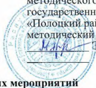
График методических мероприятий для специалистов учреждений образования на январь 2023 года